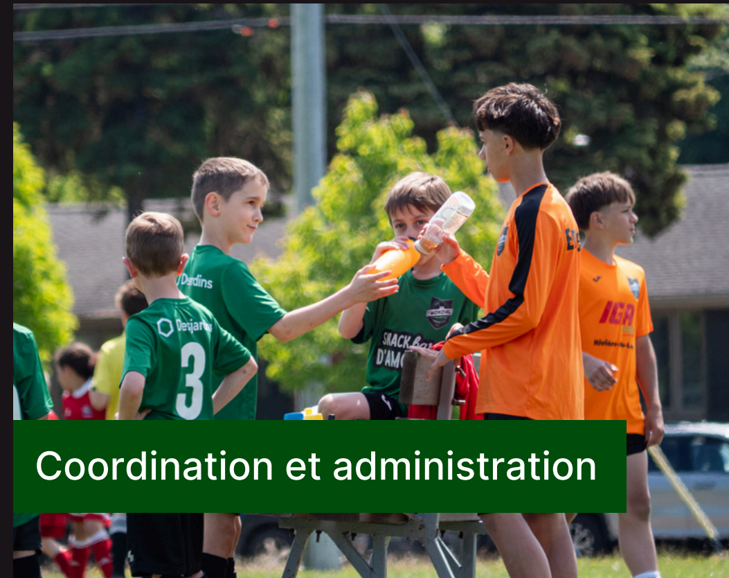
Coordination et administration

Des éducateurs certifiés et passionnés qui assurent un encadrement adapté à chaque niveau